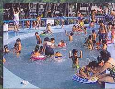
お子様にピッタリ。 海の温泉「遊らぶ湯～」