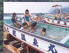
海をながめてゴク楽温泉。 舟の形の土肥温泉丸