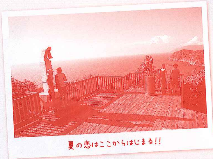
夏の恋はここからはじまる!!

遠浅の海水浴場、緑の山からはせみしぐれ。もくもくと入道雲、夕陽をあげて。宵闇には大花火。 潮騒に目をつむれば、遠い日の海。なつかしくて、やさしい土肥の休暇は、心癒す特別の夏。