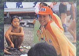
海の安全を守る ライフセーバー。