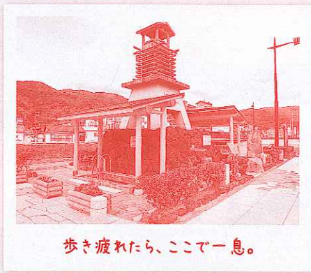
歩き疲れたら、ここで一息。

松原公園は夕陽の名所、世界一の花時計や歌碑、温泉やぐらなどが点在する松の美しい公園です。ギネス認定、直径31メートルに及ぶ「世界一の花時計」は文字通り、世界一の大きさ。季節ごとに花が植え替えられ、時を報せる音楽が流れます。