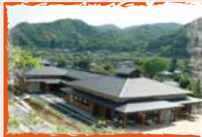
伊豆大見の郷「季多楽」