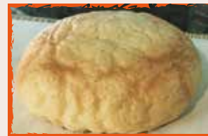
石窯パン工房 Flicker 修善寺店