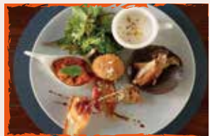
vieni KANDA (ヴィエニカンダ)