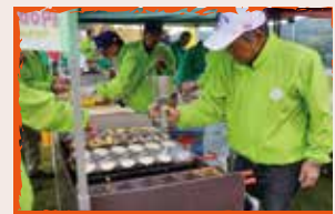
中伊豆ライオンズ