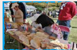
伊豆高等職業訓練校